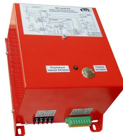
Рис. 1 Внешний вид БАО